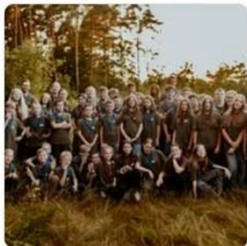
lato w Jantarze - uczestnicy i kadra obozu