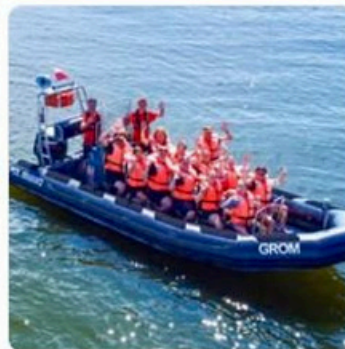
lato w Jantarze 19-20.07.2024