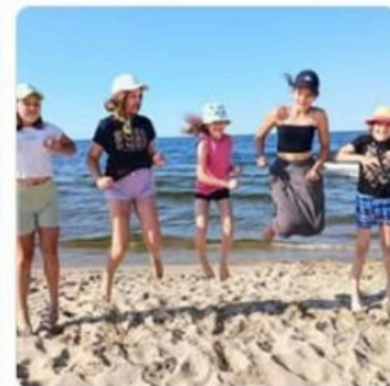
lato w Jantarze 15-18.07.2024