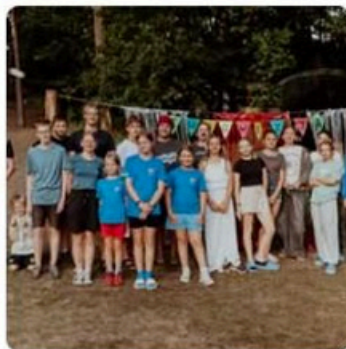
lato w Jantarze - leśna EuroWizja